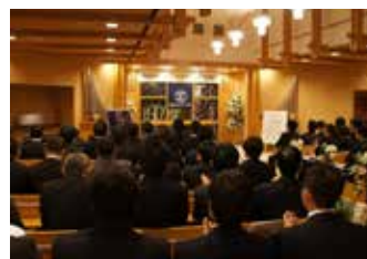
2017年12月 定時総会及び卒業式