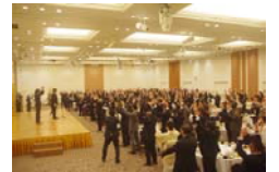
2016年3月 55周年記念式典