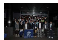
2016年10月 55周年記念研修旅行