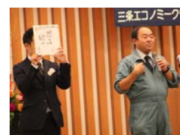
2016年9月 55周年記念公開例会