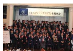
2016年12月 定時総会及び卒業式 忘年懇親会